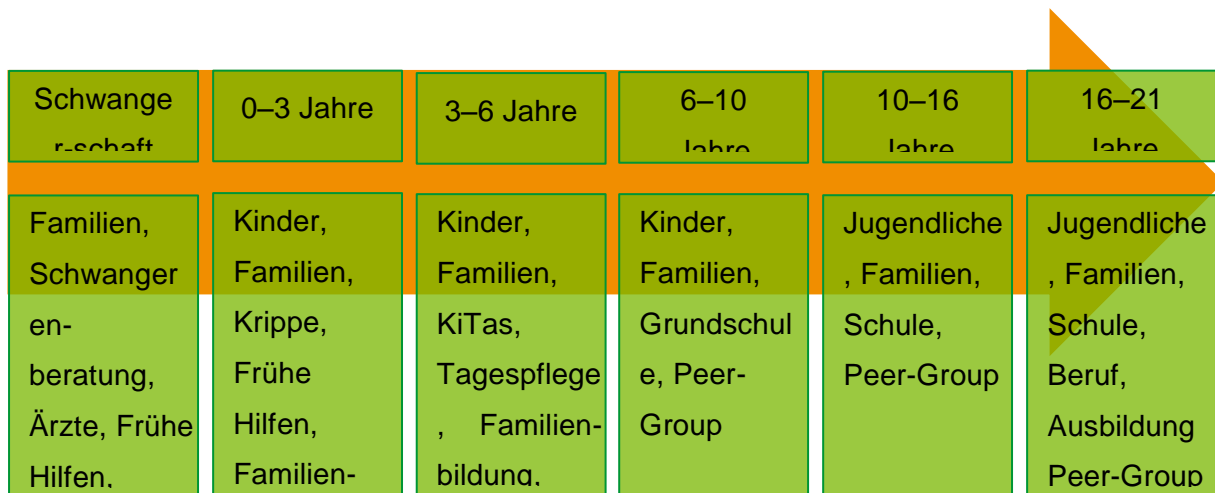
Abbildung 3 Beispiele für Handlungsfelder und Akteure einer Präventionskette

Um die präventive Unterstützung auch über die Zielgruppe der Frühen Hilfen hinaus zu gewährleisten, müssen Strukturen einer sogenannten Präventionskette geschaffen und damit die präventive Unterstützung im gesamten Kinder- und Jugendalter durch gute Vernetzung der einzelnen Kooperationspartner gewährleistet werden. Eine Präventionskette arbeitet kindzentriert, lebensweltorientiert und partizipativ. Ziel ist es durch das Zusammenführen bestehender Netzwerke, Angebote und Akteure ein tragfähiges Netz für Kinder, Jugendliche und Familien zu entwickeln und somit allen Kindern und Jugendlichen sowie ihren Familien positive Lebens- und Teilhabebedingungen zu eröffnen. Eine Präventionskette orientiert sich an den Lebensphasen der Kinder und Jugendlichen. Hierbei müssen vor allem die Übergänge von einem alters- und entwicklungsbezogenen Handlungsfeld in das nächste in den Fokus gestellt werden, da diese erhöhte Anpassungsleistungen von Kindern, Jugendlichen sowie ihren Familien erfordern.