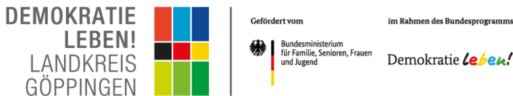
Abbildung 3: Logokombination „Demokratie leben!“, Quelle: „Demokratie leben! Landkreis GP“.

Im Frühjahr 2020 wurde für die „Partnerschaft für Demokratie“ ein eigenes Logo gestaltet, um ein Wiedererkennungswert im Landkreis hervorzurufen.